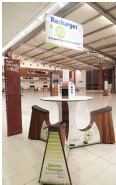
⇒ 'Sobno kolo' za polnjenje pametnih telefonov na letališču La Tontouata na Novi Kaledoniji

Varovanje okolja mora biti skrb vseh, čeprav o škodljivosti človeških