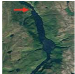
➤ Hidroelektrarna Alta na Norveškem ima moč 200 MW.