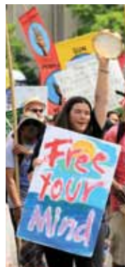
📍 Podnebni protesti v Washingtonu leta 2017

Pravzaprav imamo veliko srečo, da po našem najboljšem znanstvenem znanju človeški izpusti toplogrednih plinov dejansko ne povzročajo nobenih globalno (iz)merljivih posledic. Kajti če bi res povzročali nevarne podnebne spremembe, kot jih napoveduje Medvladni odbor za podnebne spremembe (IPCC), politiki in (pre)več medijev, bi nam ob dejanskem učinku vladnih ter mednarodnih ukrepov za razogljichenje grozila neizogibna katastrofa.